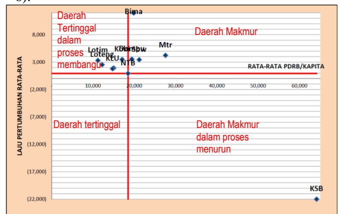
Gambar 3. Sebaran dalam Tipologi Klassen.

Status daerah makmur yang diindikasikan oleh PDRB perkapita dan rata-rata laju pertumbuhan selama 5 tahun mempunyai nilai lebih tinggi dari daerah referensi meliputi Kabupaten Sumbawa, Kabupaten Dompu, Kabupaten Bima dan Kota Mataram. Status daerah tertinggal dalam proses membangun, yang diindikasikan oleh rata-rata laju pertumbuhan lebih tinggi dari daerah referensi namun rata-rata PDRB perkapita lebih rendah, ditempati oleh Kabupaten Lombok Barat, Lombok Tengah, Lombok Timur, Lombok Utara dan Kota Bima. Sedangkan daerah makmur dalam proses menurun yang diindikasikan oleh rata-rata PDRB perkapita lebih tinggi dari daerah referensi dan rata-rata laju pertumbuhan lebih rendah, ditempati Kabupaten Sumbawa Barat. Untuk meningkatkan kemakmuran daerah, maka pemerintah Provinsi Nusa Tenggara Barat perlu memberikan perhatian lebih terhadap daerah dengan status tertinggal dalam proses membangun, melalui perluasan pasar terutama bagi sektor yang belum mampu menjangkau ekspor sehingga akan memberi kontribusi ekonomi daerah. Sedangkan pada daerah makmur dalam proses menurun, perlu dilakukan peningkatan produksi, peningkatan kualitas, dan peningkatan SDM yang mampu memperbaiki proses produksi. Gambar 3 menunjukkan penempatan masing-masing daerah Kabupaten dan Kota dalam 4 kuadran sesuai dengan perhitungan dalam tipologi Klassen (Tabel 6).